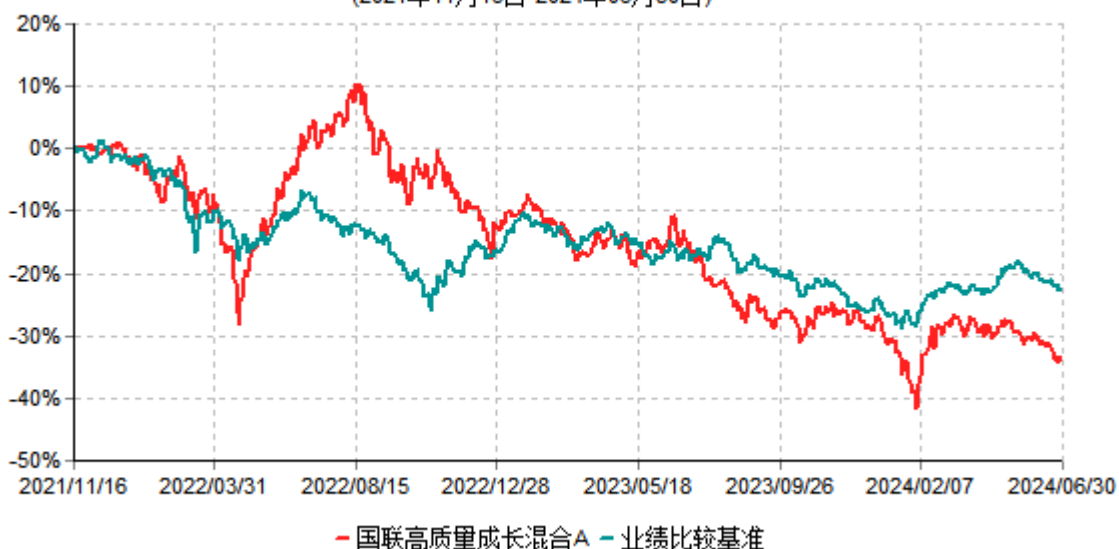
国联高质量成长混合A累计净值增长率与业绩比较基准收益率历史走势对比图 (2021年11月16日-2024年06月30日)