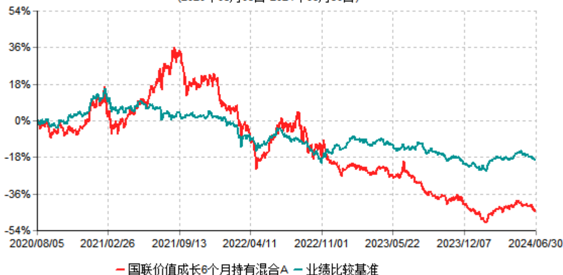
国联价值成长6个月持有混合A累计净值增长率与业绩比较基准收益率历史走势对比图 (2020年08月05日-2024年06月30日)