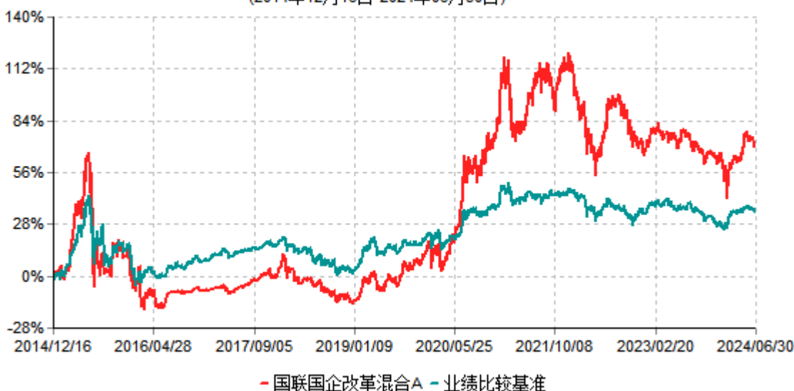
国联国企改革混合A累计净值增长率与业绩比较基准收益率历史走势对比图 (2014年12月16日-2024年06月30日)