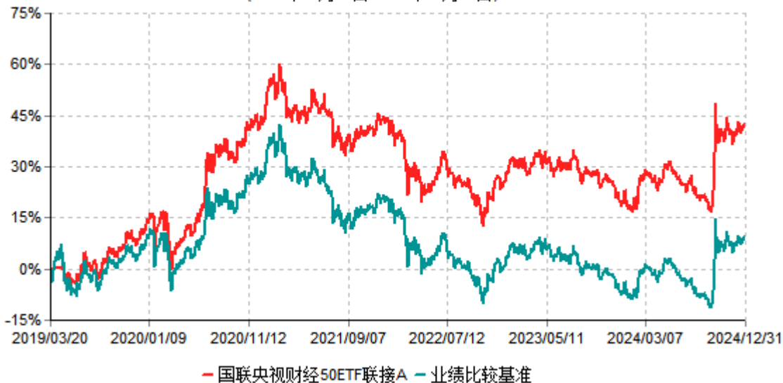
国联央视财经50ETF联接A累计净值增长率与业绩比较基准收益率历史走势对比图 (2019年03月20日-2024年12月31日)