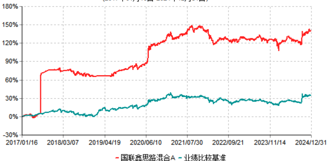
国联鑫思路混合A累计净值增长率与业绩比较基准收益率历史走势对比图 (2017年01月16日-2024年12月31日)