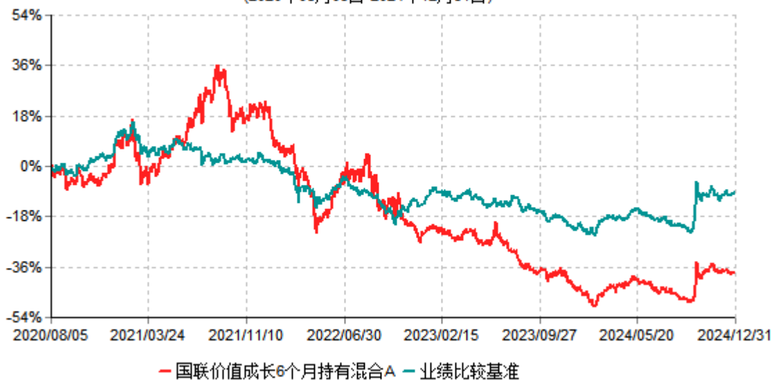
国联价值成长6个月持有混合A累计净值增长率与业绩比较基准收益率历史走势对比图 (2020年08月05日-2024年12月31日)