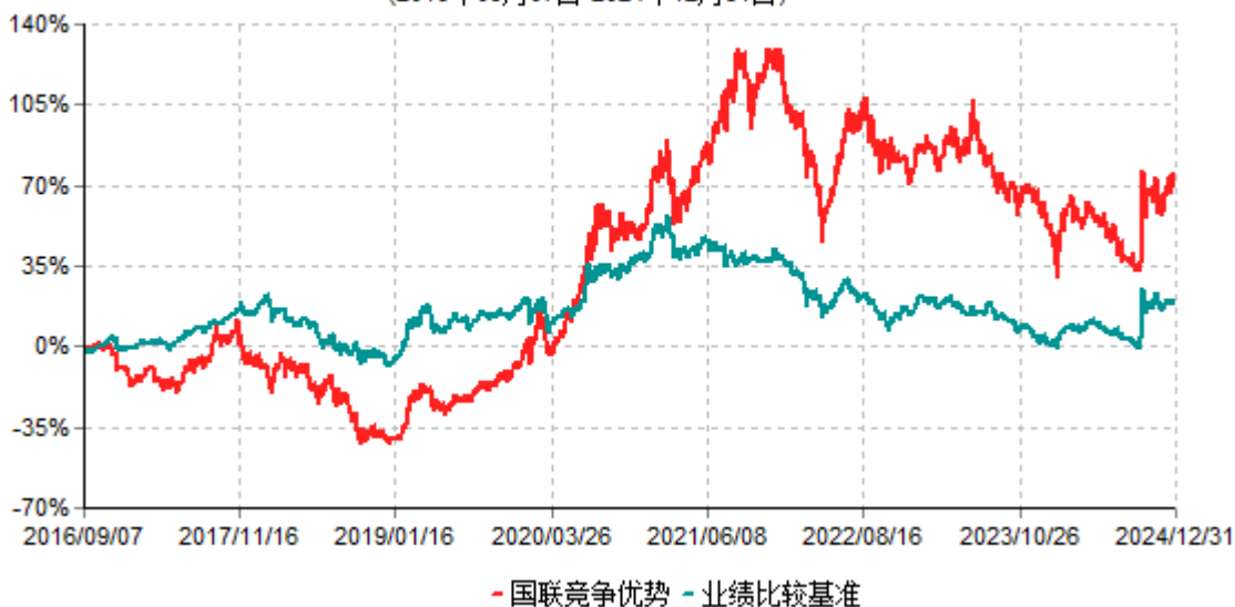
国联竞争优势累计净值增长率与业绩比较基准收益率历史走势对比图 (2016年09月07日-2024年12月31日)

注：按基金合同和招募说明书的约定，本基金自基金合同生效日起6个月内为建仓期，建仓期结束时本基金的各项投资比例符合基金合同的有关约定。