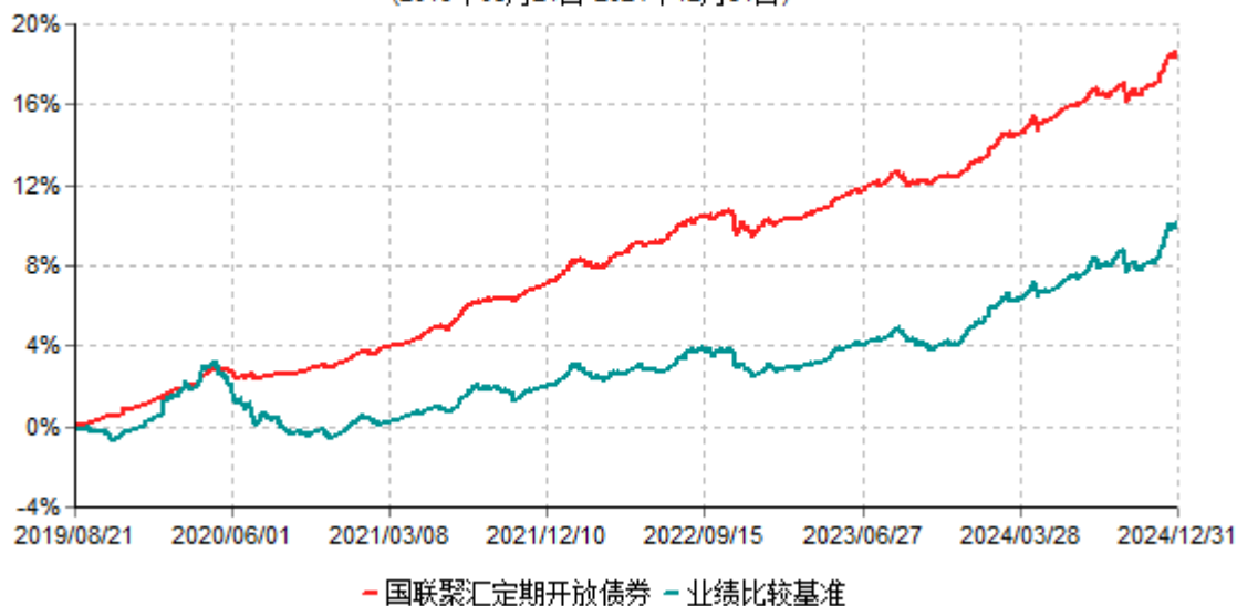
国联聚汇定期开放债券累计净值增长率与业绩比较基准收益率历史走势对比图 (2019年08月21日-2024年12月31日)

注：按基金合同和招募说明书的约定，本基金自基金合同生效日起6个月内为建仓期，建仓期结束时本基金的各项投资比例符合基金合同的有关约定。