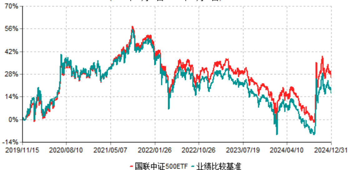
国联中证500ETF累计净值增长率与业绩比较基准收益率历史走势对比图 (2019年11月15日-2024年12月31日)

注：按基金合同和招募说明书的约定，本基金自基金合同生效日起6个月内为建仓期，建仓期结束时本基金的各项投资比例符合基金合同的有关约定。