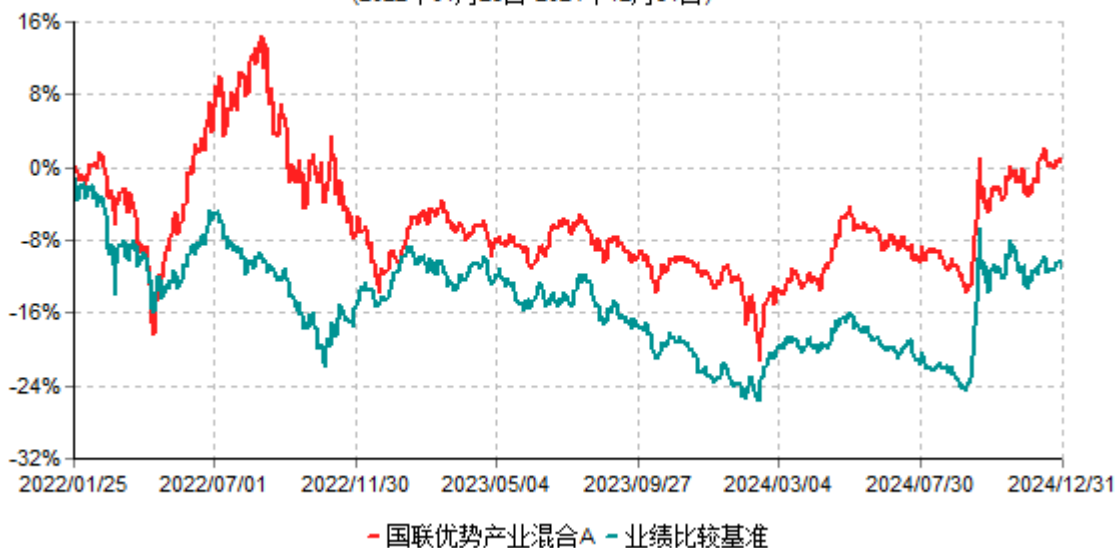
国联优势产业混合A累计净值增长率与业绩比较基准收益率历史走势对比图 (2022年01月25日-2024年12月31日)