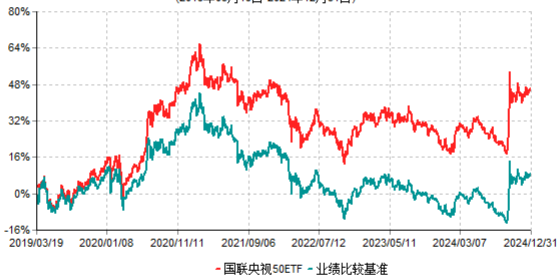
国联央视50ETF累计净值增长率与业绩比较基准收益率历史走势对比图 (2019年03月19日-2024年12月31日)

注：按基金合同和招募说明书的约定，本基金自基金合同生效日起6个月内为建仓期，建仓期结束时本基金的各项投资比例符合基金合同的有关约定。