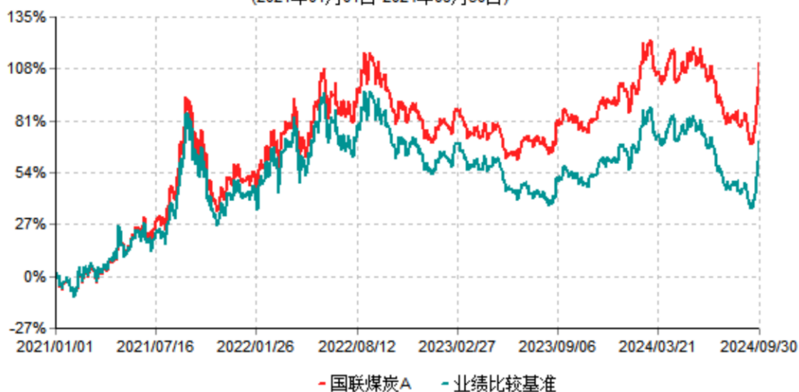
国联煤炭A累计净值增长率与业绩比较基准收益率历史走势对比图 (2021年01月01日-2024年09月30日)