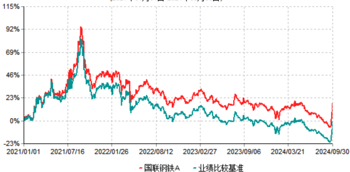
国联钢铁A累计净值增长率与业绩比较基准收益率历史走势对比图 (2021年01月01日-2024年09月30日)