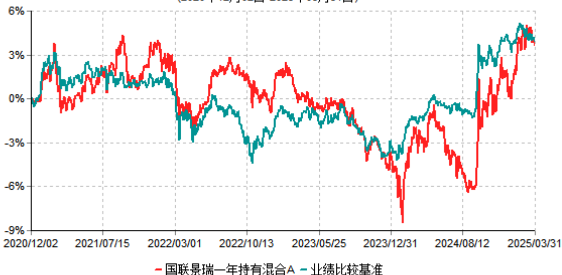
国联景瑞一年持有混合A累计净值增长率与业绩比较基准收益率历史走势对比图 (2020年12月02日-2025年03月31日)