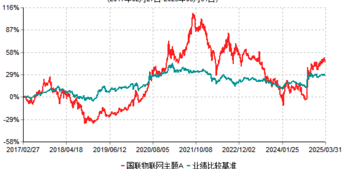
国联物联网主题A累计净值增长率与业绩比较基准收益率历史走势对比图 (2017年02月27日-2025年03月31日)