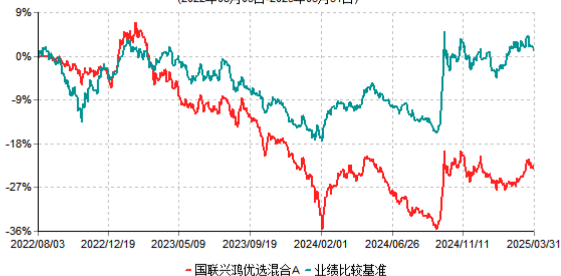
国联兴鸿优选混合A累计净值增长率与业绩比较基准收益率历史走势对比图 (2022年08月03日-2025年03月31日)