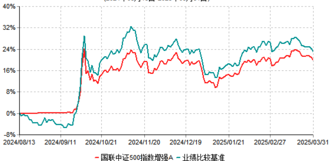
国联中证500指数增强A累计净值增长率与业绩比较基准收益率历史走势对比图 (2024年08月13日-2025年03月31日)