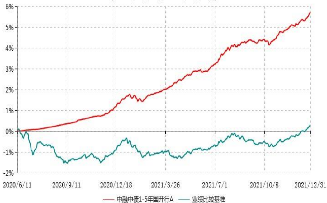
中融中债1-5年国开行A累计净值增长率与业绩比较基准收益率历史走势对比图 (2020年06月11日-2021年12月31日)