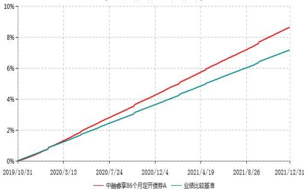
中融睿享86个月定开债券A累计净值增长率与业绩比较基准收益率历史走势对比图 (2019年10月31日-2021年12月31日)