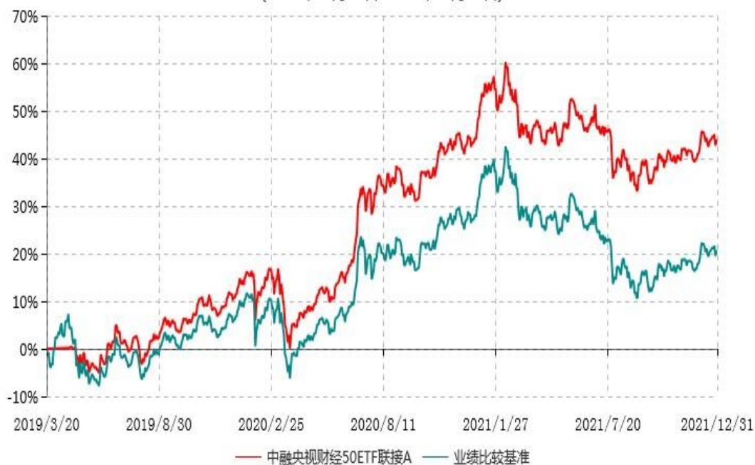
中融央视财经50ETF联接A累计净值增长率与业绩比较基准收益率历史走势对比图 (2019年03月20日-2021年12月31日)