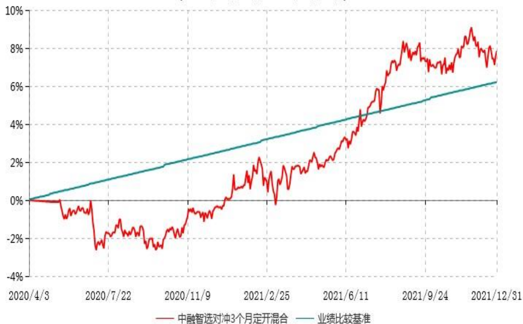
中融智选对冲策略3个月定期开放灵活配置混合型发起式证券投资基金累计净值增长率与业绩比较基准收益率历史走势对比图 (2020年04月03日-2021年12月31日)

注：按基金合同和招募说明书的约定，本基金自基金合同生效日起6个月内为建仓期，建仓期结束时本基金的各项投资比例符合基金合同的有关约定。