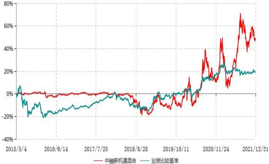
中融新机遇灵活配置混合型证券投资基金累计净值增长率与业绩比较基准收益率历史走势对比图 (2015年05月04日-2021年12月31日)

注：按基金合同和招募说明书的约定，本基金自基金合同生效日起6个月内为建仓期，建仓期结束时本基金的各项投资比例符合基金合同的有关约定。