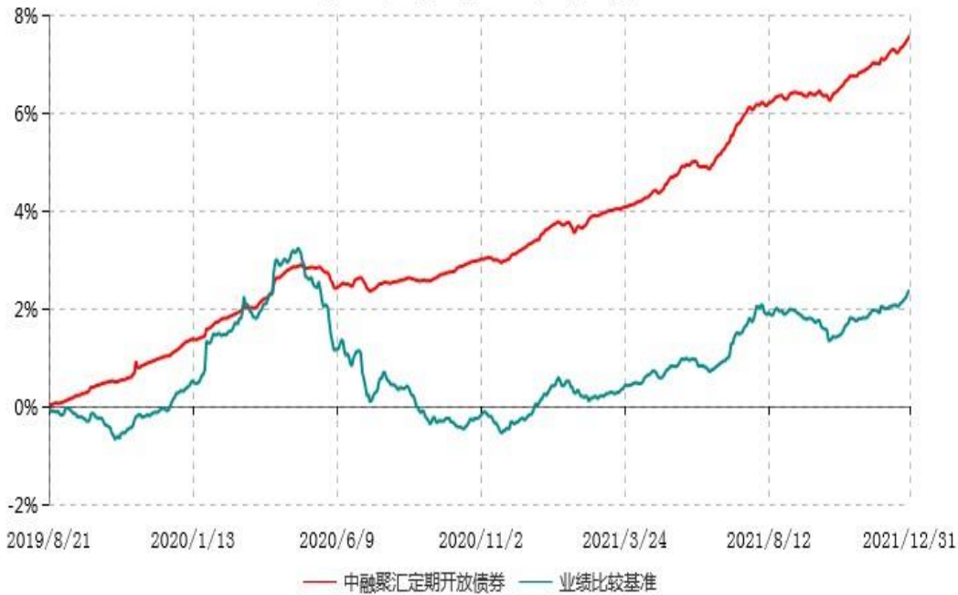
中融聚汇3个月定期开放债券型发起式证券投资基金累计净值增长率与业绩比较基准收益率历史走势对比图 (2019年08月21日-2021年12月31日)

注：按基金合同和招募说明书的约定，本基金自基金合同生效日起6个月内为建仓期，建仓期结束时本基金的各项投资比例符合基金合同的有关约定。