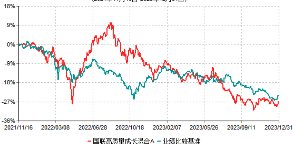
国联高质量成长混合A累计净值增长率与业绩比较基准收益率历史走势对比图 (2021年11月16日-2023年12月31日)