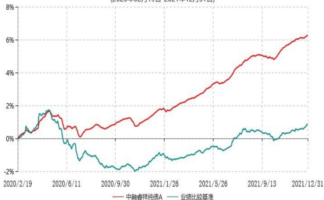
中融睿祥纯债C累计净值增长率与业绩比较基准收益率历史走势对比图