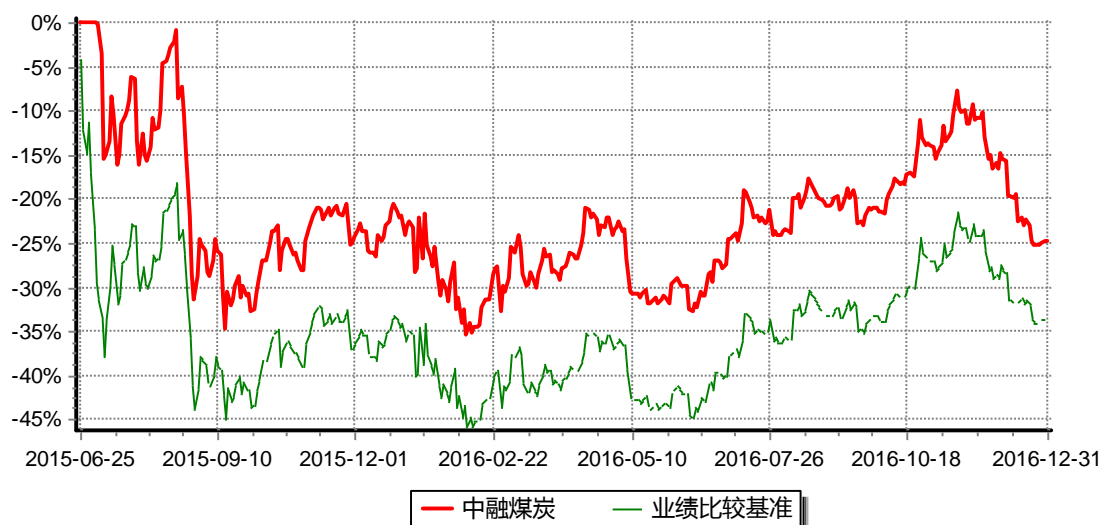
图：中融中证煤炭指数分级证券投资基金份额累计净值增长率与同期业绩比较基准收益率的历史走势对比图