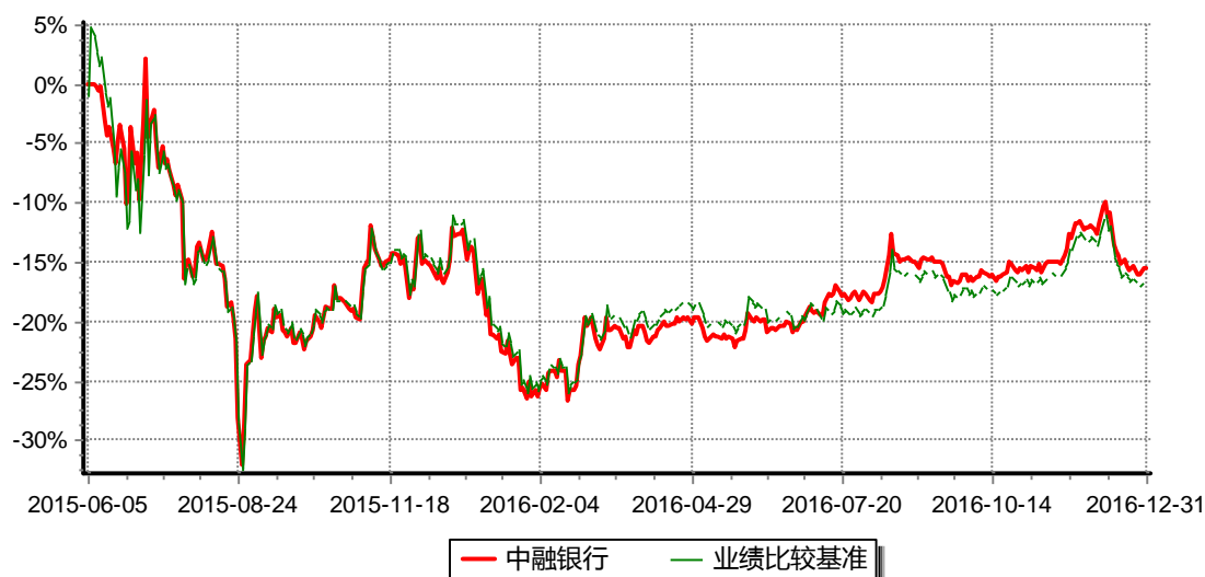
图：中融中证银行指数分级证券投资基金份额累计净值增长率与同期业绩比较基准收益率历史走势对比图