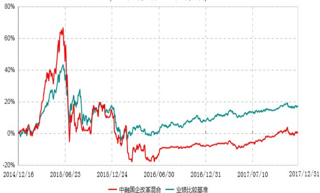
中融国企改革灵活配置混合型证券投资基金累计净值增长率与业绩比较基准收益率历史走势对比图 (2014年12月16日-2017年12月31日)

注：按照基金合同和招募说明书的约定，本基金自合同生效日起6个月内为建仓期，建仓期结束时本基金的各项资产配置比例符合基金合同的有关约定。