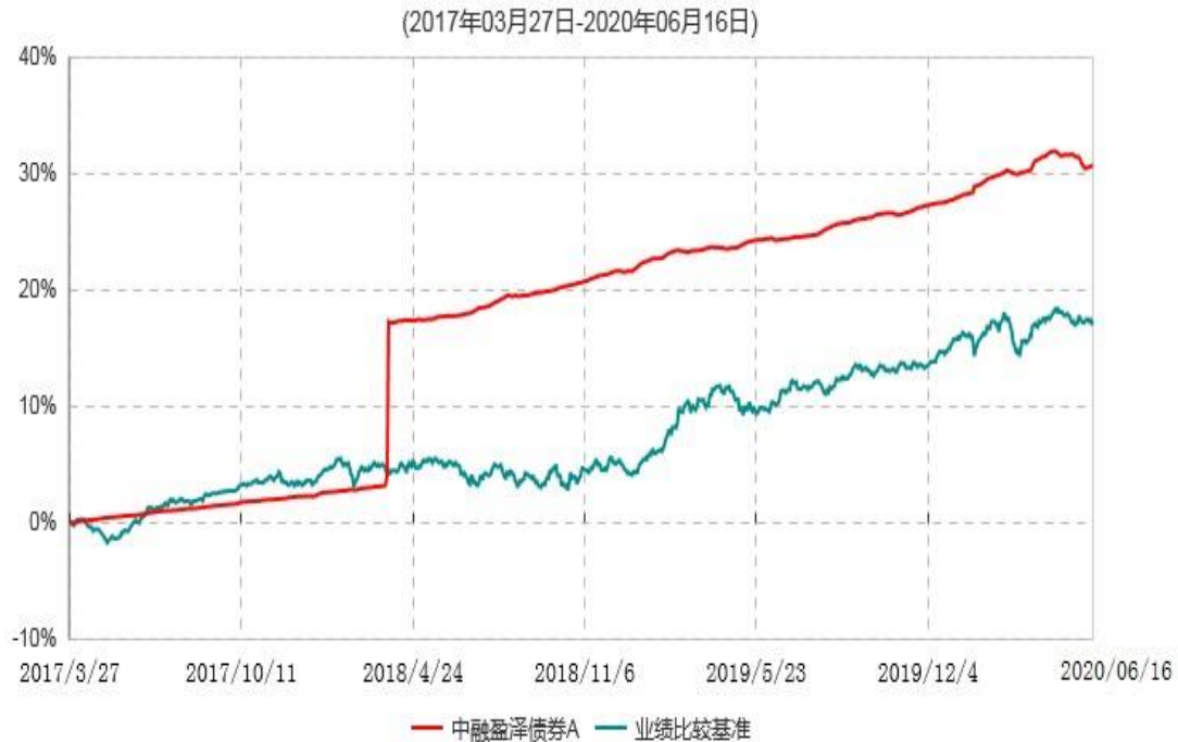
中融盈泽债券A累计净值增长率与业绩比较基准收益率历史走势对比图