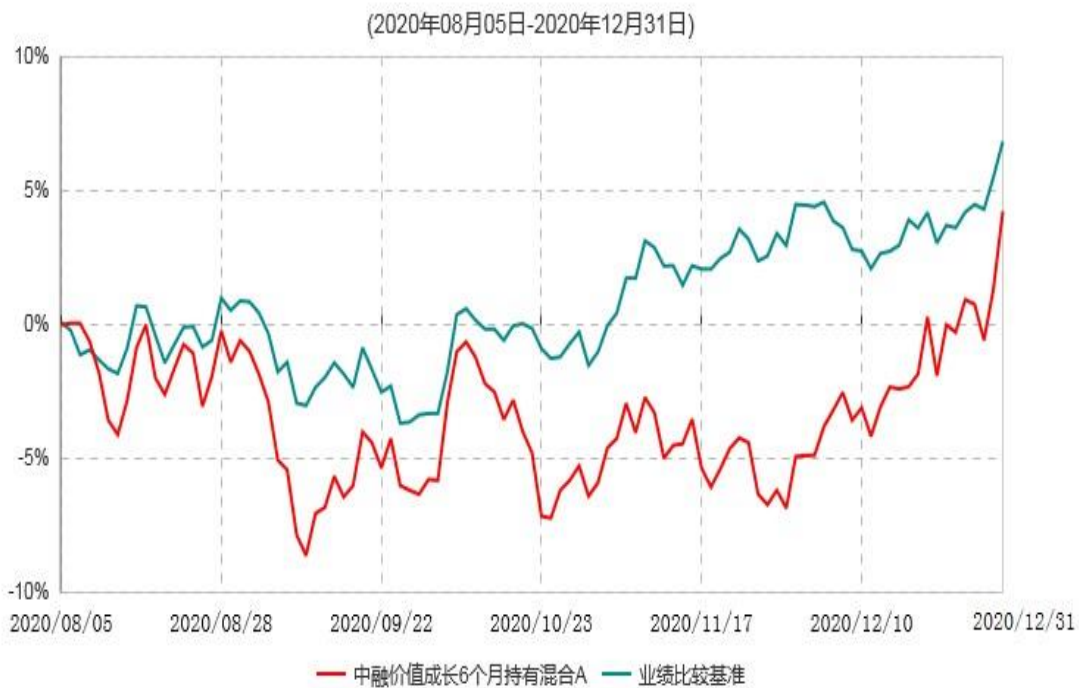
中融价值成长6个月持有混合A累计净值增长率与业绩比较基准收益率历史走势对比图