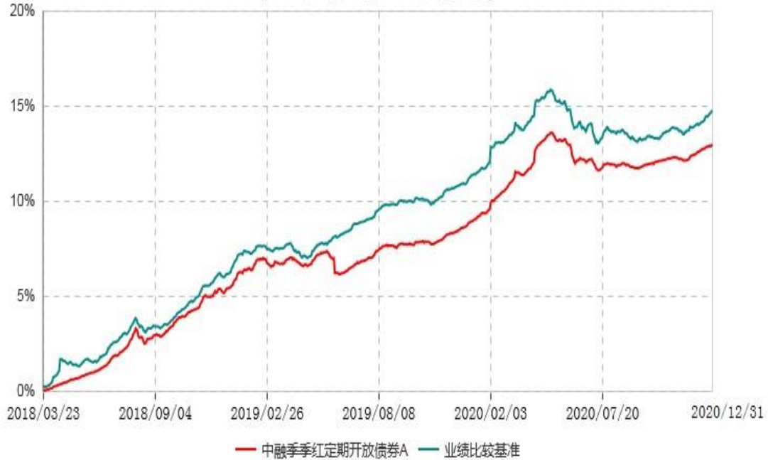
中融季季红定期开放债券A累计净值增长率与业绩比较基准收益率历史走势对比图 (2018年03月23日-2020年12月31日)