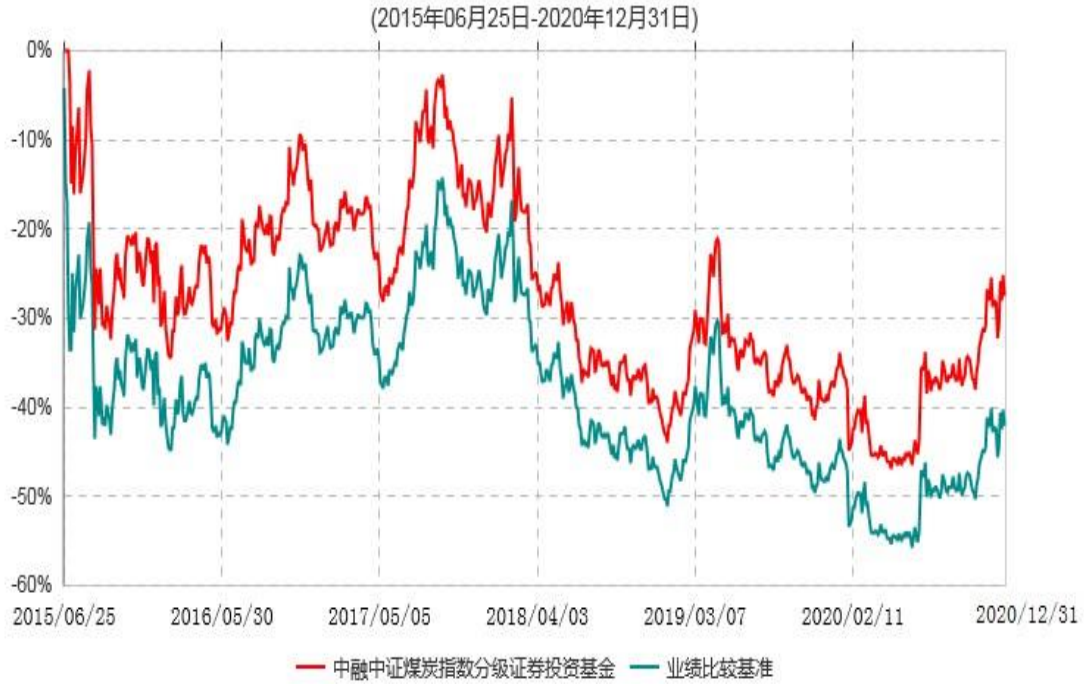
中融中证煤炭指数分级证券投资基金累计净值增长率与业绩比较基准收益率历史走势对比图

注：按基金合同和招募说明书的约定，本基金自基金合同生效日起6个月内为建仓期，建仓期结束时本基金的各项投资比例符合基金合同的有关约定。