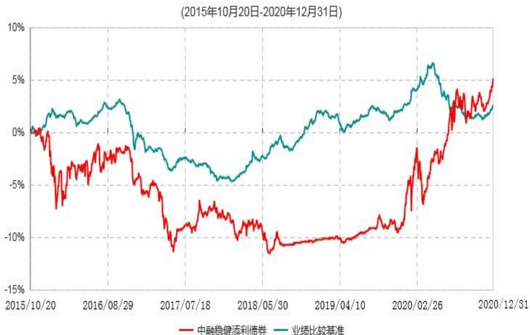
中融稳健添利债券型证券投资基金累计净值增长率与业绩比较基准收益率历史走势对比图

注：按基金合同和招募说明书的约定，本基金自基金合同生效日起6个月内为建仓期，建仓期结束时本基金的各项投资比例符合基金合同的有关约定。