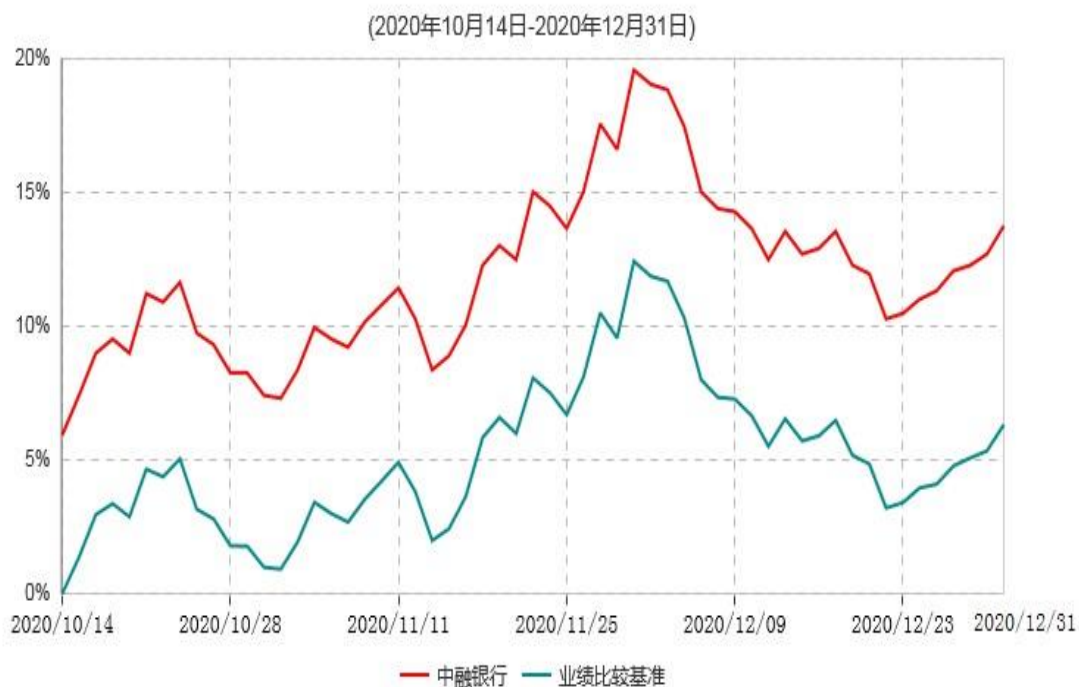
中融中证银行指数证券投资基金（LOF）累计净值增长率与业绩比较基准收益率历史走势对比图