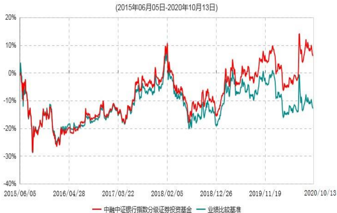
中融中证银行指数分级证券投资基金累计净值增长率与业绩比较基准收益率历史走势对比图